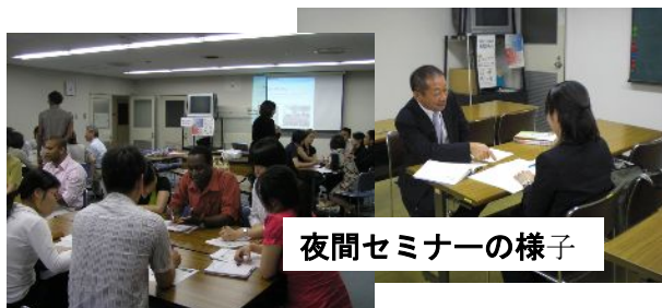
夜間セミナーの様子

※参加を希望される方でまだ申込をされていない場合（締め切り後）は、教頭先生を通して担当までお電話ください。